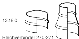
13.18.0 Blechverbinder 270-271 Metal Connector 270-271