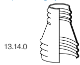
13.14.0 Warmschrumpfmuffe 223 Heat Shrink Sleeve 223