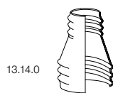
13.14.0 Warmshrumpmuffe 223 Heat Shrink Sleeve 223